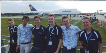
YoungPilots als Aussteller auf der ILA 2012