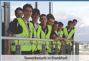
Towerbesuch in Frankfurt

Bereits 3 NFF-Kurse erfolgreich abgeschlossen