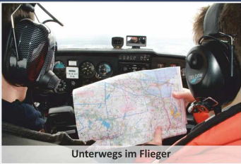
Unterwegs im Flieger