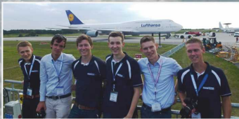
YoungPilots als Aussteller auf der ILA 2012